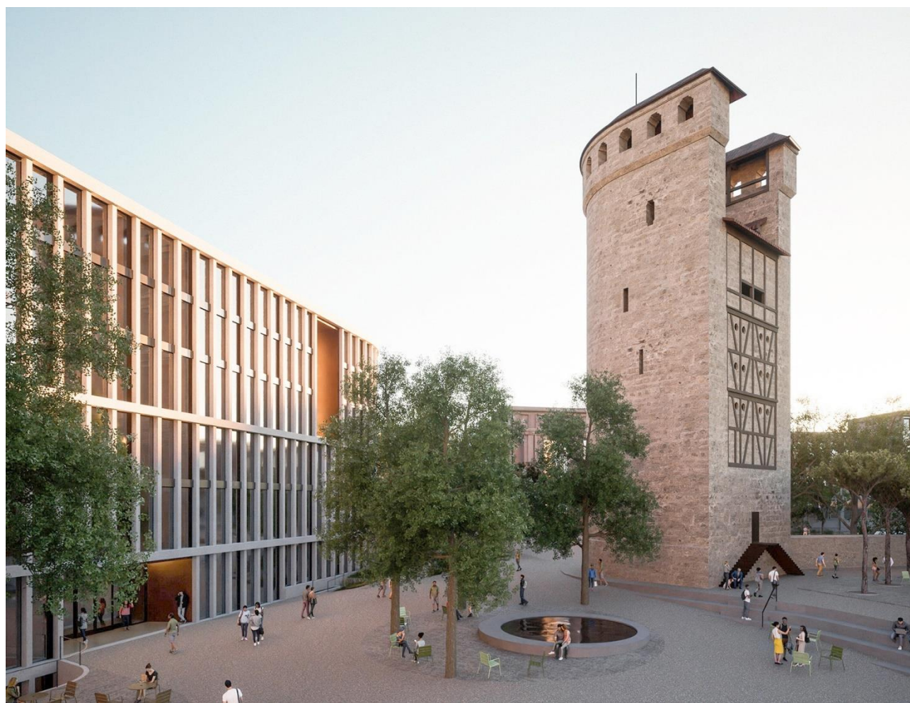
Fig.2: Vue d'ensemble du projet « Equité » version Avant-Projet 2023

En lien avec le concept de mobilité douce, un garage à vélo a été intégré dans le garage souterrain existant. Ce dernier doit par ailleurs être adapté aux prescriptions actuellement en vigueur, notamment pour la protection incendie en adaptant la ventilation, le désenfumage et les sorties de secours.